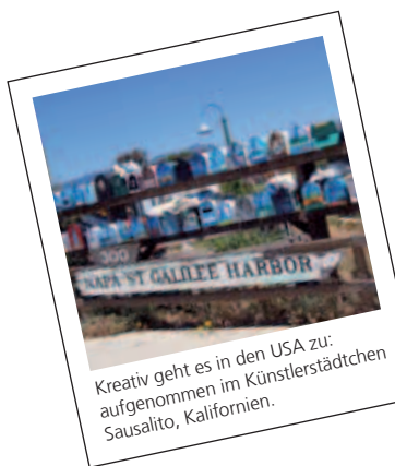
Kreativ geht es in den USA zu: aufgenommen im Künstlerstädtchen Sausalito, Kalifornien.