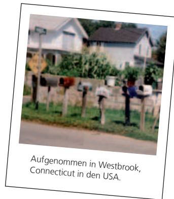
Aufgenommen in Westbrook, Connecticut in den USA.