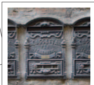
„Den E-Postbrief könnte ich fressen!!!“ Aufgenommen in Italien.